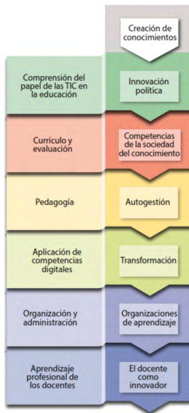
Figura 3. Creación de conocimiento.