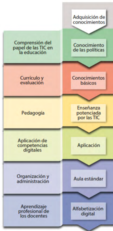
Figura 1. Adquisición de conocimiento.

En las siguientes figuras se plasma la relación del conocimiento es tres aspectos: adquisición, profundización y creación.